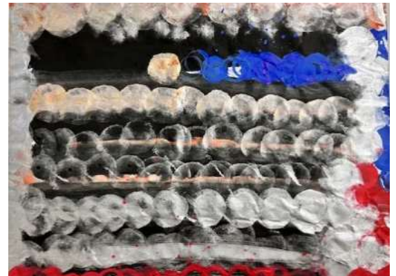
(左) 西谷さん「氷の女王」 (中) 吉原さん「不動明王」 (右) 山口さん「夜光虫-noctiluca-」