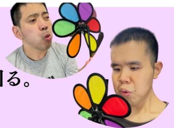
顔面筋を動かす運動

レクリエーションは全て利用者様向けに視覚優位になるよう工夫していただいています。いつも皆さん楽しんで参加してくださいませ。昨年度の取り組みでは全職員(パート含め)へ歯科衛生士から直接歯磨き指導を受けスキルアップを図ってきました。磨き残しは明らかに軽減しています。なかなかお口を開けれない方も開けて下さるようになったり、仕上げ磨きできなかった方が、少しずつお口の中を見せて下さるようになり色々な形で効果が出ています。また、利用者様全員の口腔内を歯科衛生士にみていただき個別に注意すべき点も確認しています。皆さんの健康維持のために昼食後のみになりますが継続して力を入れていきます。