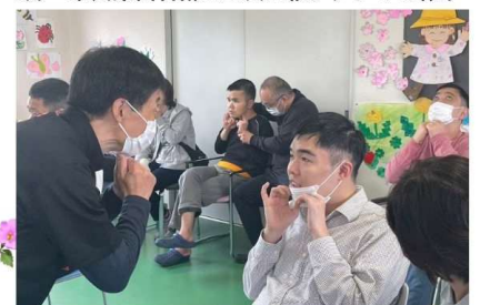
唾液腺マッサージ