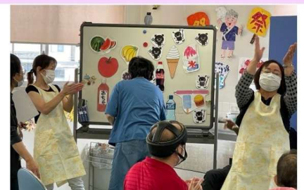
8月 奈良県歯科衛生士会主催ケアラボの様子

レクリエーションは全て利用者様向けに視覚優位になるよう工夫していただいています。いつも皆さん楽しんで参加してくださいませ。昨年度の取り組みでは全職員(パート含め)へ歯科衛生士から直接歯磨き指導を受けスキルアップを図ってきました。磨き残しは明らかに軽減しています。なかなかお口を開けれない方も開けて下さるようになったり、仕上げ磨きできなかった方が、少しずつお口の中を見せて下さるようになり色々な形で効果が出ています。また、利用者様全員の口腔内を歯科衛生士にみていただき個別に注意すべき点も確認しています。皆さんの健康維持のために昼食後のみになりますが継続して力を入れていきます。